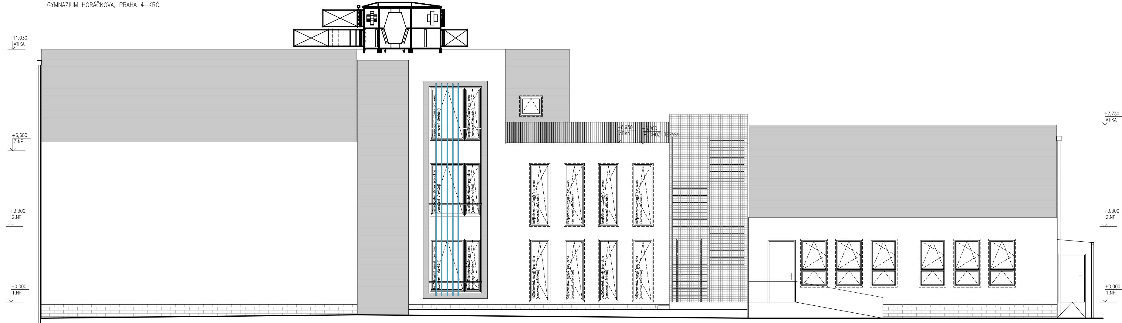
POHLED VÝCHODNÍ GYMNÁZIUM HORÁČKOVA, PRAHA 4–KRČ